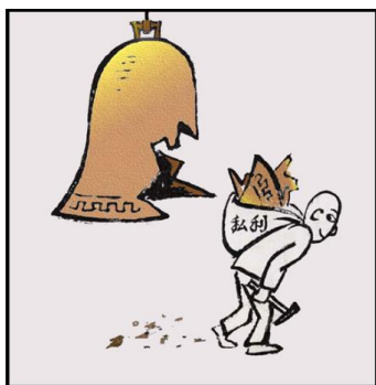
《谁说我当和尚不撞钟》

漫画寄托着画者对于某种事物或现象强烈的感慨，以大胆夸张的手法和强烈的视觉冲击，表达对贪官污吏和官僚主义不作为不担当等现象的强烈讽刺，成为了纪检监察宣传工作的一种重要表现形式。